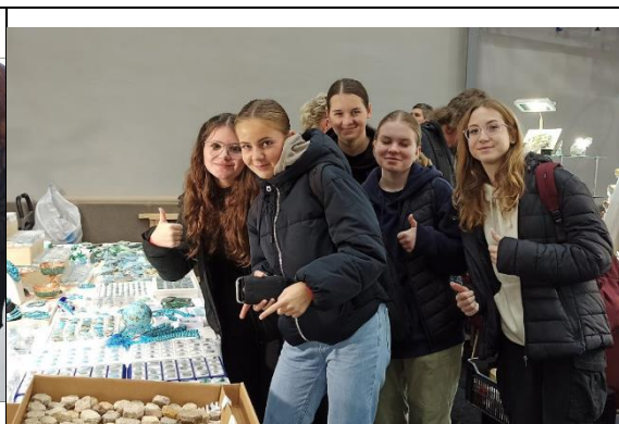
Devátáci na Mezinárodní mineralogické burze v Tišnově dne 3.11.