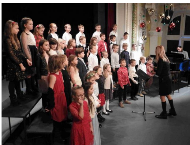
K tradičním akcím patří také adventní koncert dětských pěveckých sborů našich žáků.