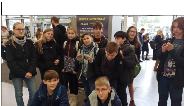
EM-kroužek na Mineralogické výstavě v Brně 17.11.