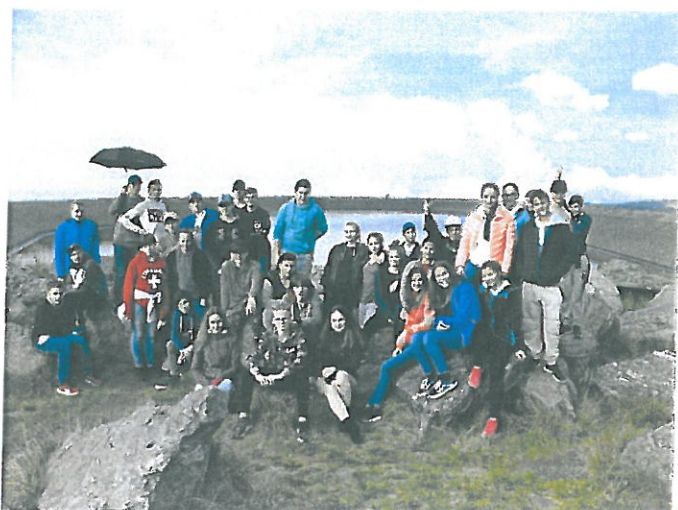
Návštěva vodního díla Dlouhé Stráně