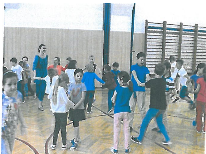
Hry ve školní družině

Akce ŠD, jejich plánování, zajištění, organizace včetně informací pro rodiče: viz tabulka