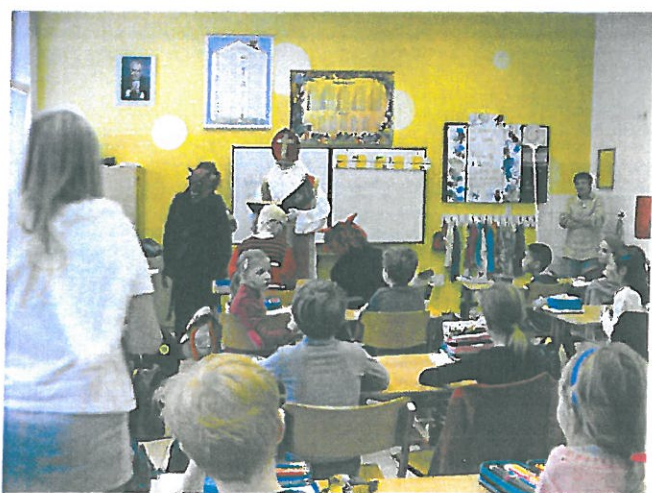
Mikuláš ve škole