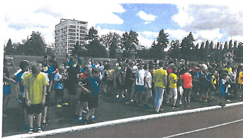
Sportovní den ZŠEZ