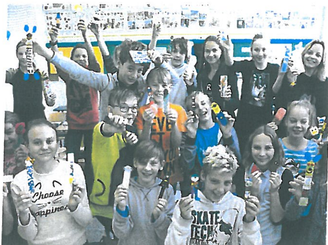
Záložka do knihy - soutěž