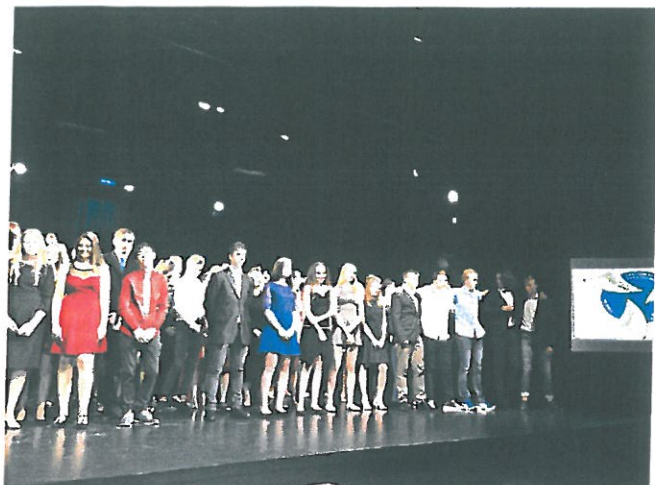
Rozloučení žáků 9. ročníku