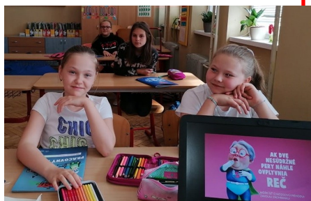
Štvrtáčky pri výukovom programe