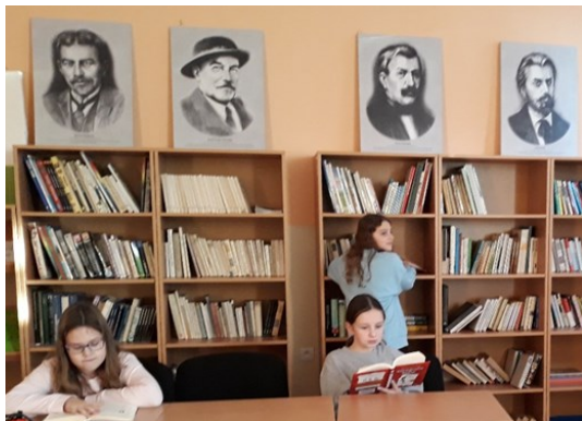
Žiačky 6.A pri čítaní

Knižnica je miesto tiché, kde sú milé knihy skryté. Z knižiek sa vždy čítať dá, veď je tvoja jediná..., čo ťa uspí, preberie, s učením ti pomôže. Knižky sú múdre ako sovy, hoci nechodili nikdy do školy. Knižky tie sú fajn, tak si jednu prečítaj. Každej knižke som vždy rada, je tam často dobrá rada. Knižnica je miesto pre malých i veľkých, tak si povedz - dosť už bolo telky. Je v nej miesto jednoducho pre všetkých, vstúp a jej čaro pochopíš.