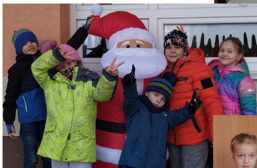
Deti z ŠKD pri aktivitách

Obrazový materiál a komentár poskytli: Bc. D. Hrivnáková a K. Školnová.