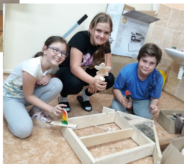
Žiaci 5.A na technickom krúžku