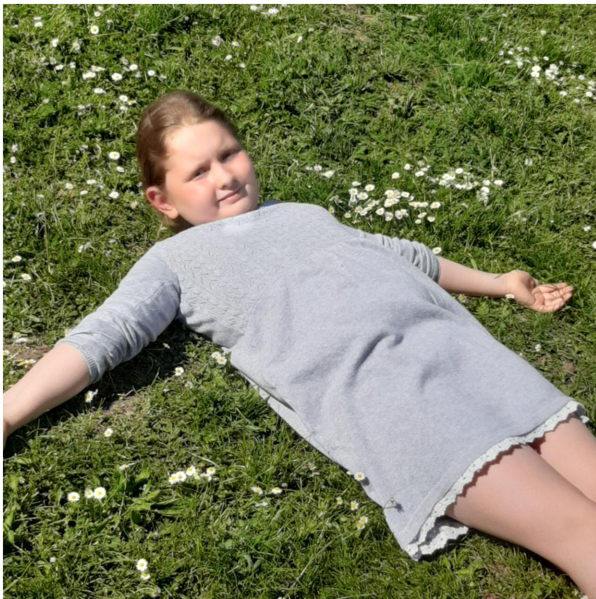
Zabawa i odpoczynek na łonie natury