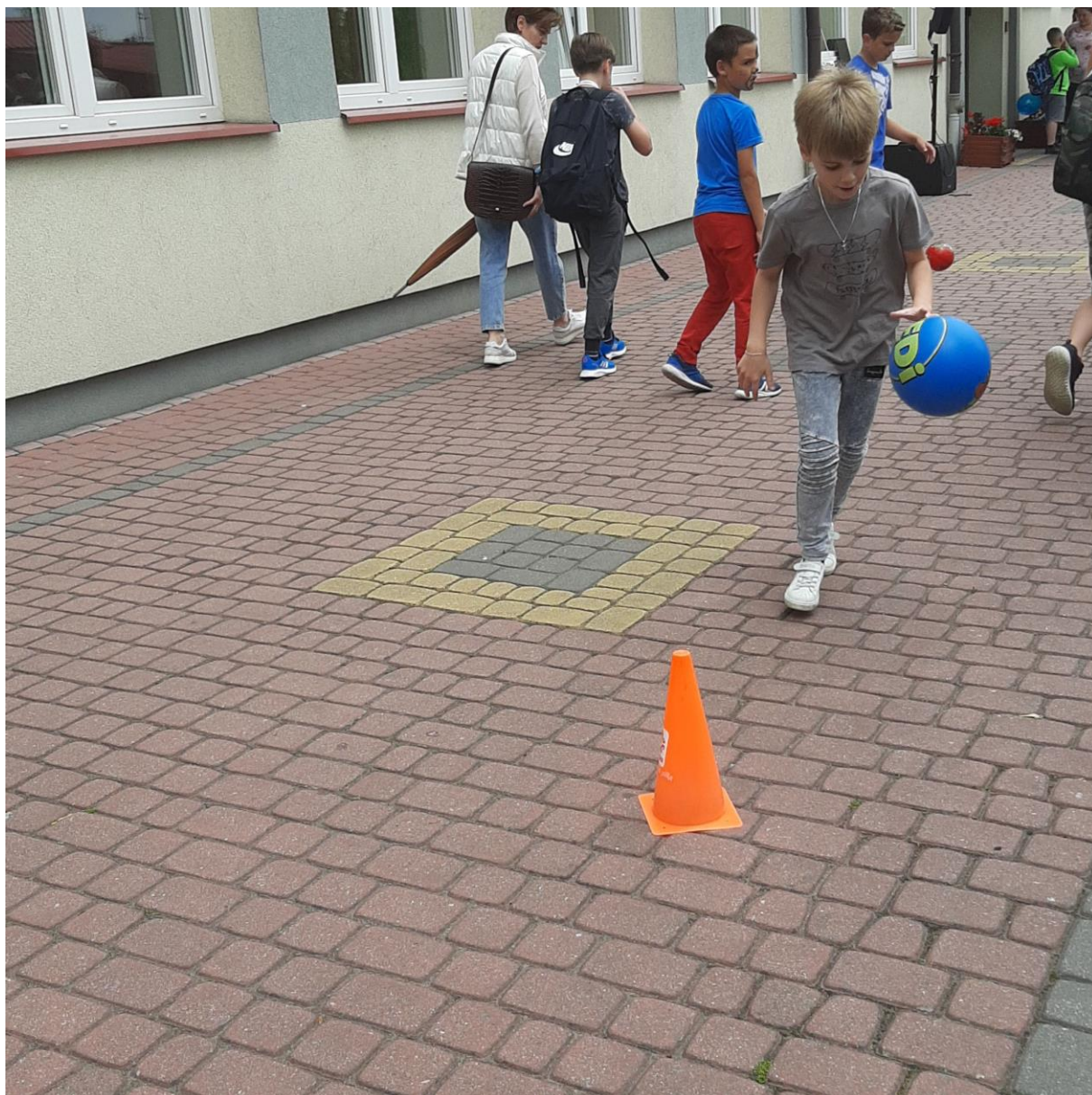
Zabawy z piłką przed szkołą