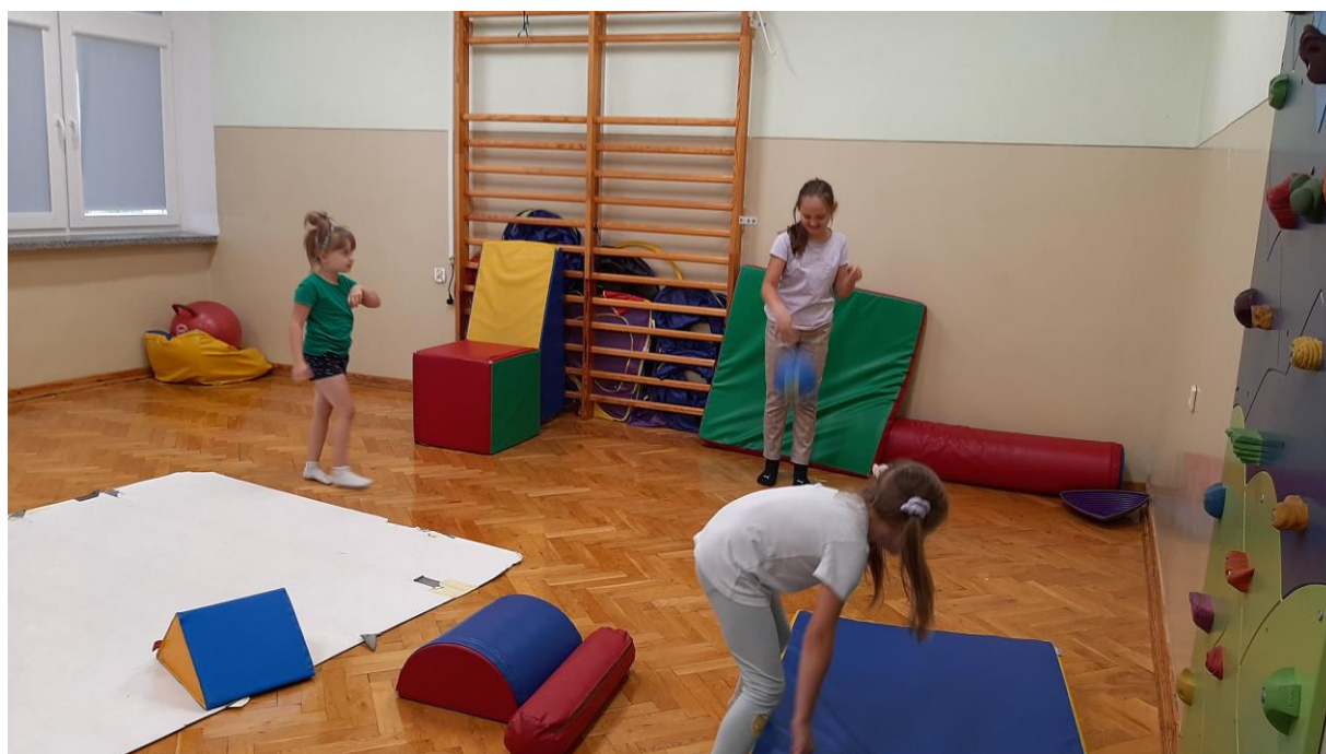
Zabawy w Sali Radosna Szkoła