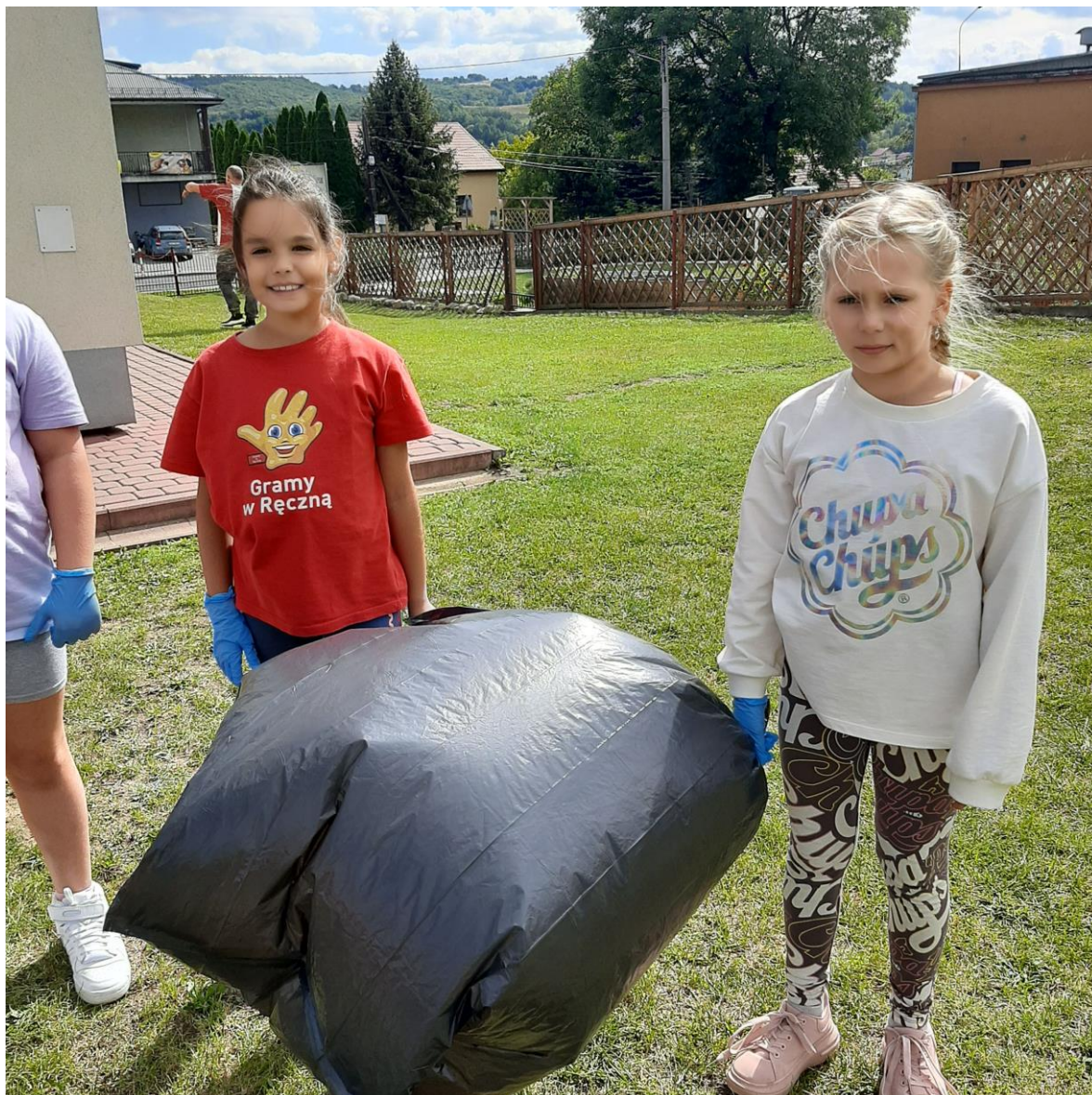
Pełne wyposażenie do sprzątania