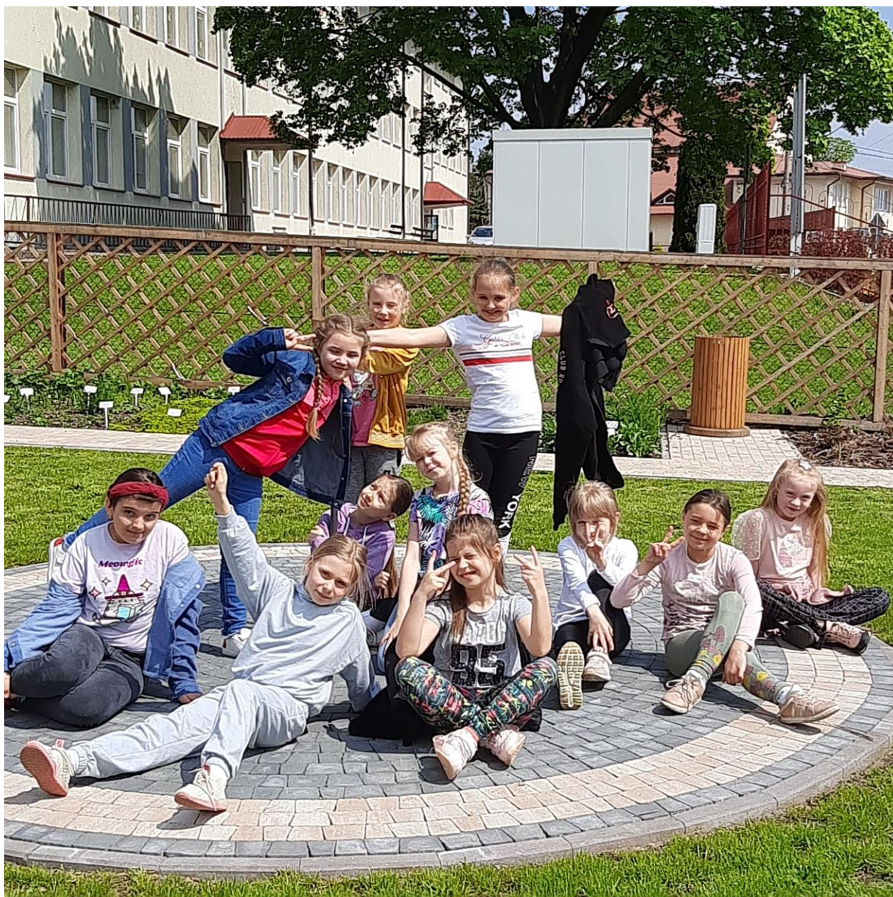
Zabawa i relaks