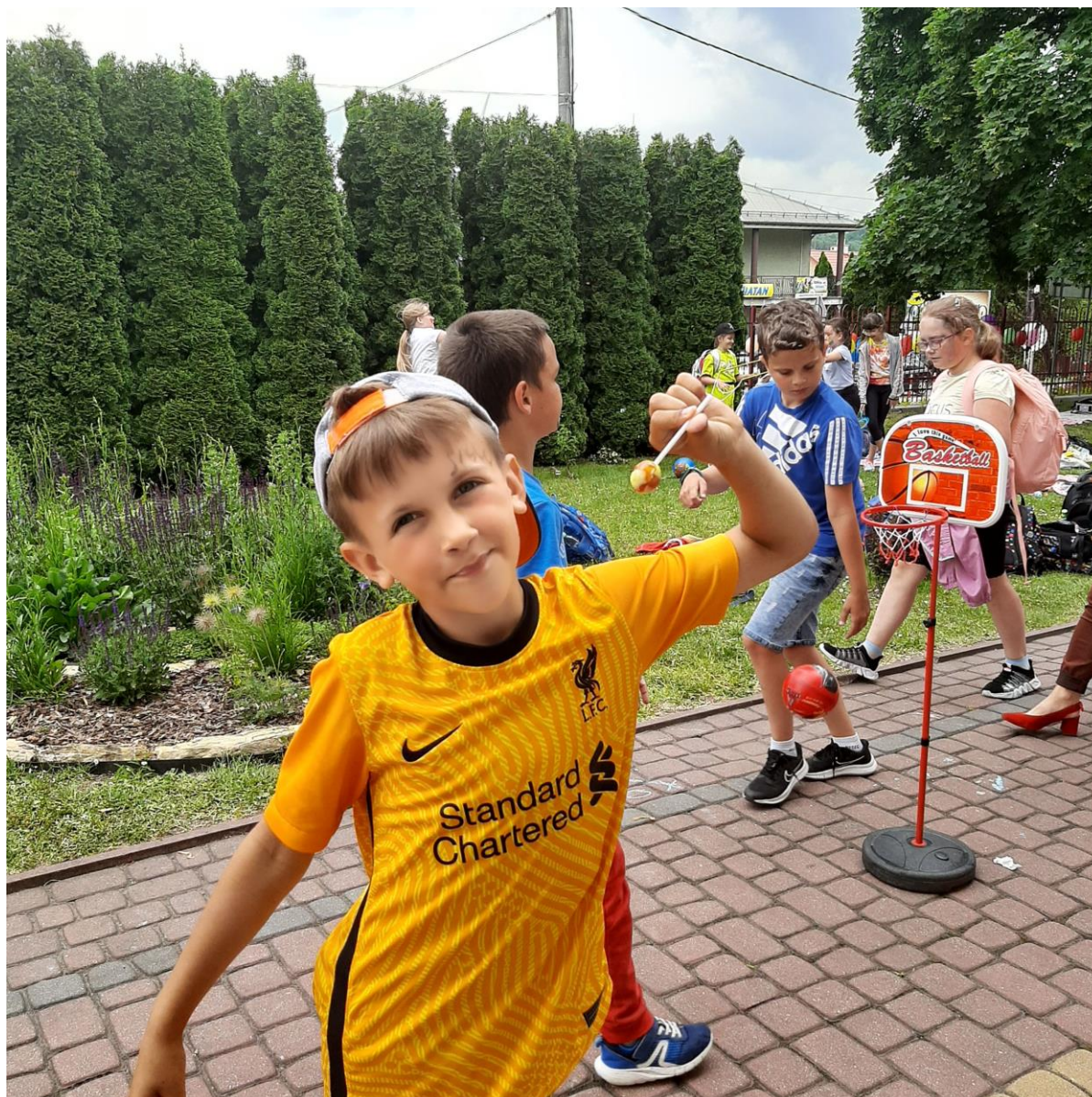
Zabawy na świeżym powietrzu