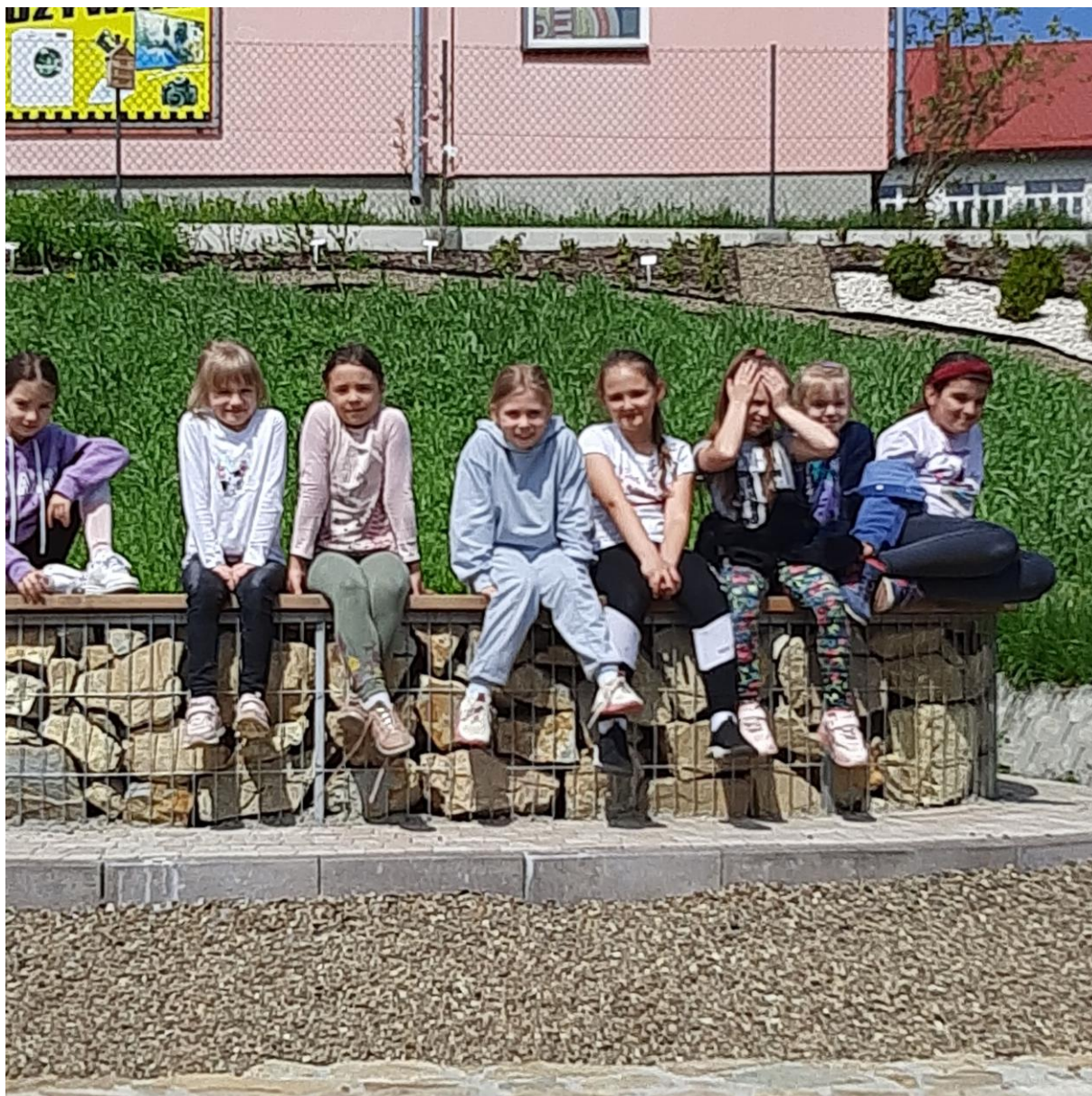
Odpoczynek w ogrodzie botanicznym