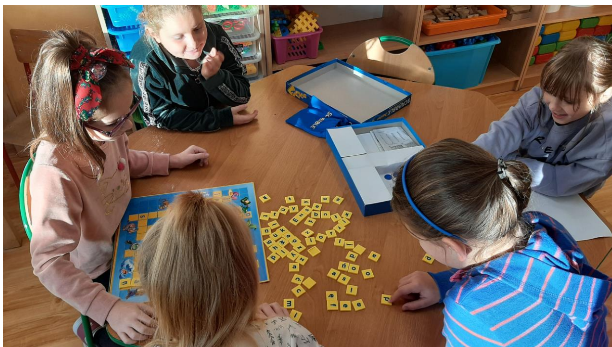
Gry stolikowe w świetlicy

Współpracujemy z organizacjami szkolnymi, uczestnicząc w akcjach szkolnych np. „Sprzątanie świata”.