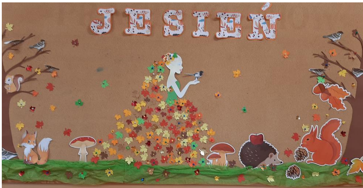
Gazetki ścienne w Świetlicy