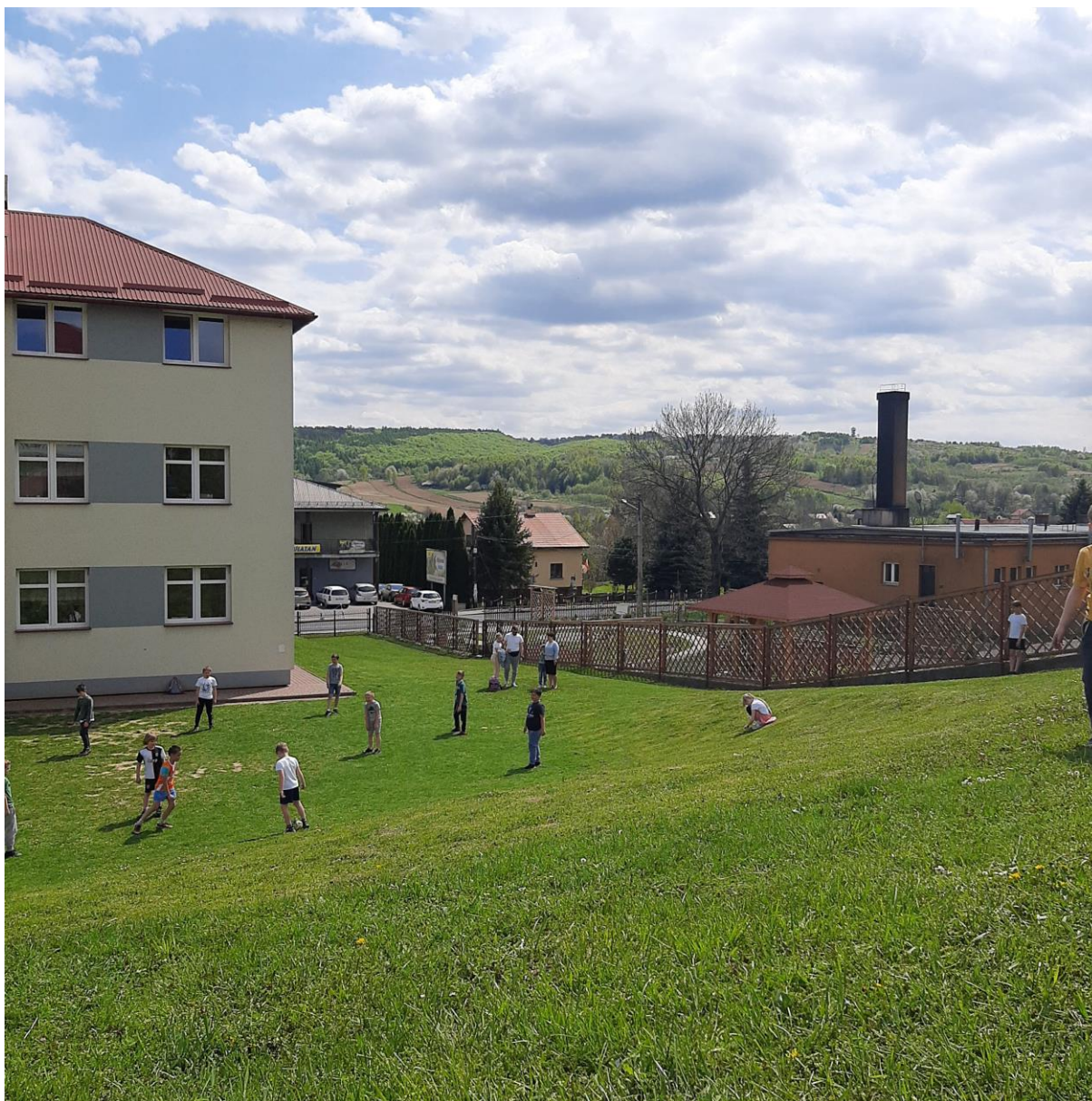
Zabawy z piłką na szkolnym podwórku