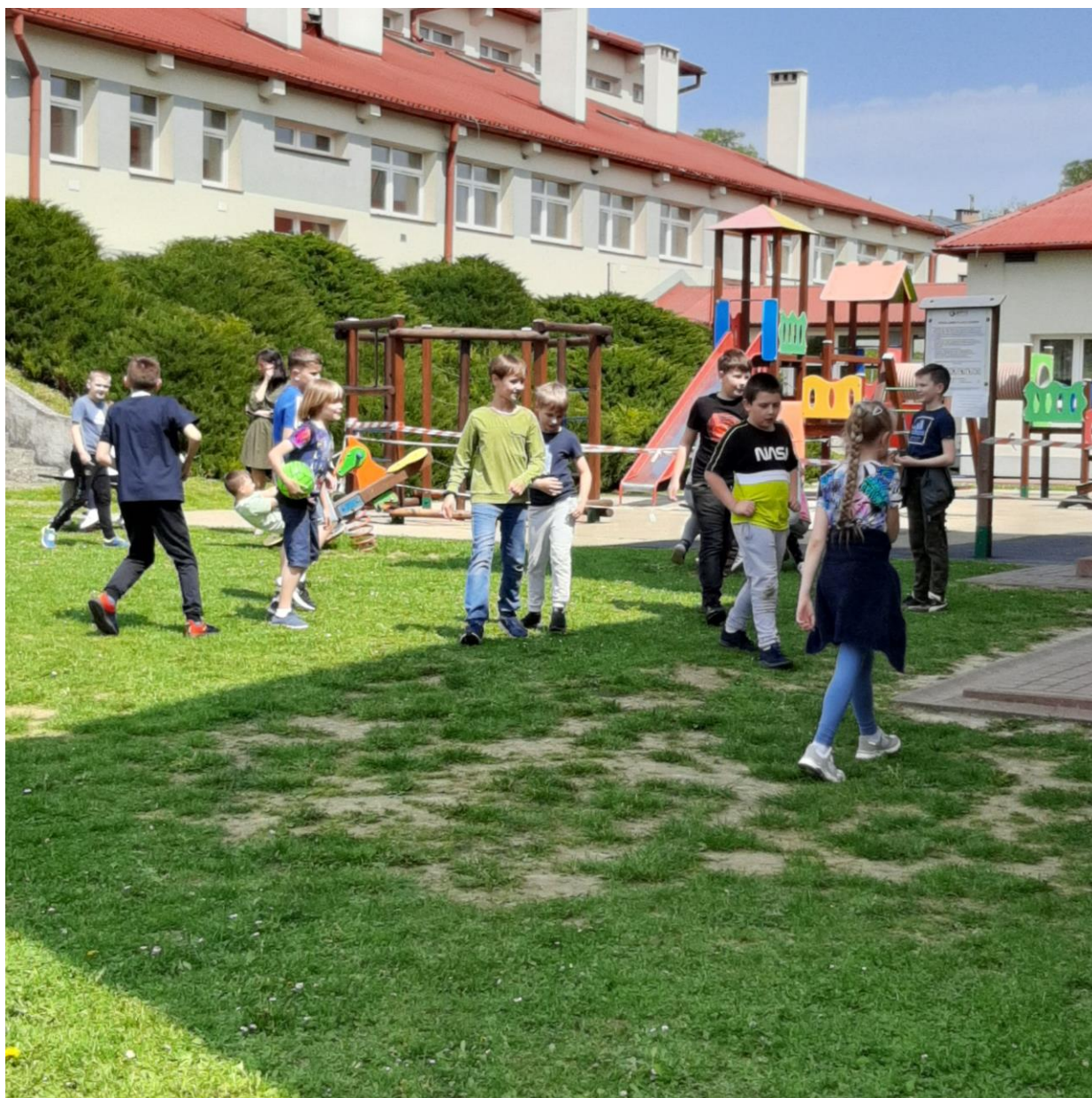
Wybór drużyny przed meczem