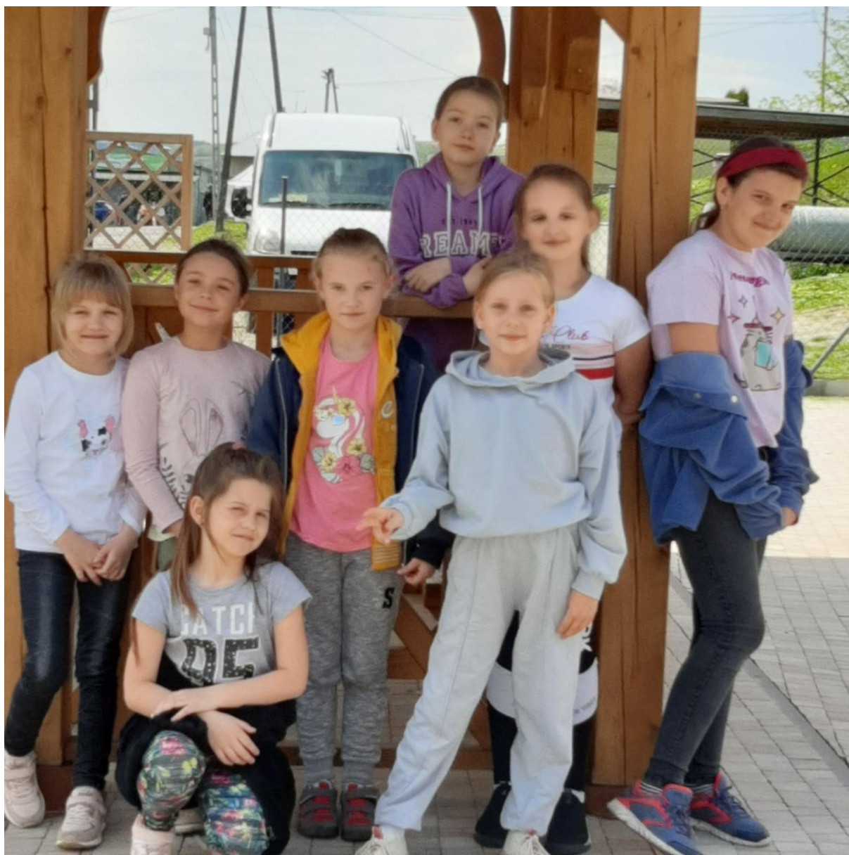
Ogród Botaniczny im. Krystyny Sowińskiej przy Szkole Podstawowej Nr 1 w Pruchniku