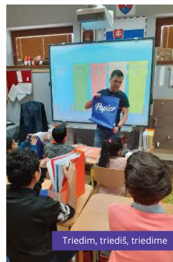
Triedim, triediš, triedime