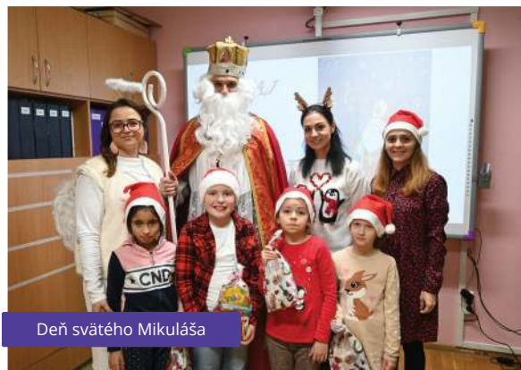
Deň svätého Mikuláša