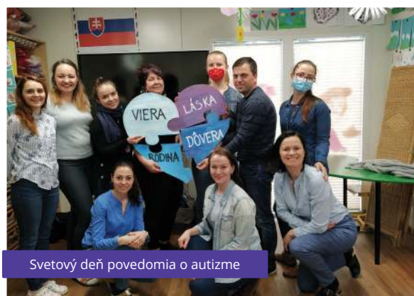
Svetový deň povedomia o autizme