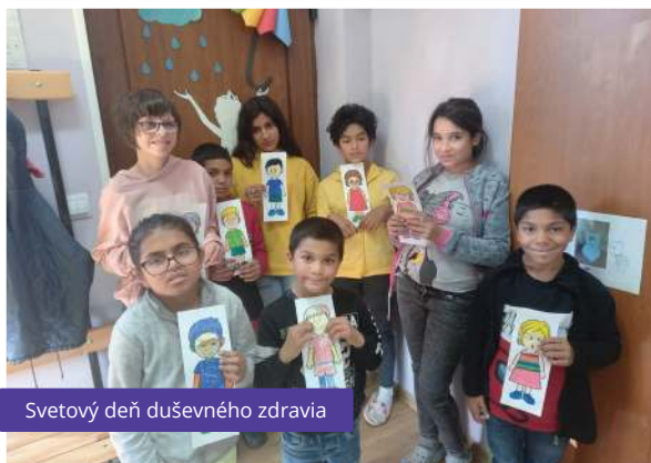
Svetový deň duševného zdravia