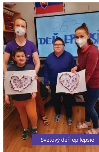
Svetový deň epilepsie