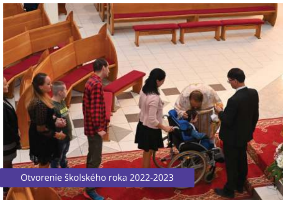
Otvorenie školského roka 2022-2023