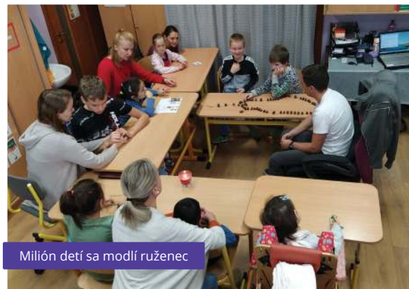
Milión detí sa modlí ruženec