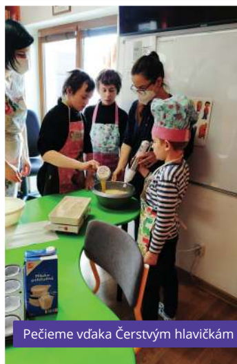
Pečieme vďaka Čerstvým hlavičkám