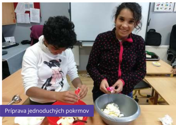
Príprava jednoduchých pokrmov