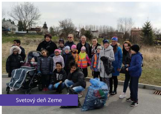
Svetový deň Zeme