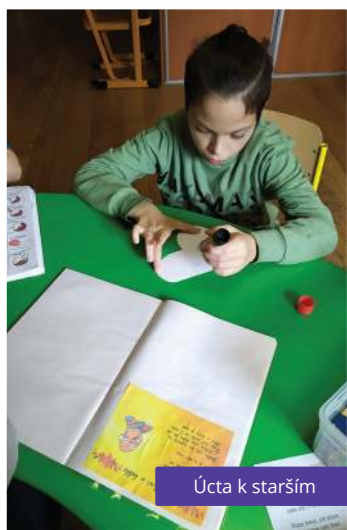
Úcta k starším