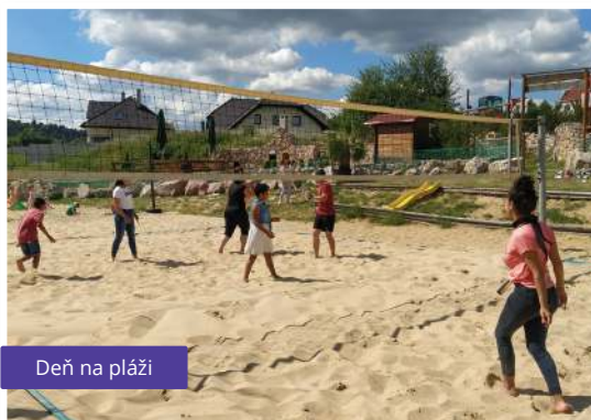
Deň na pláži