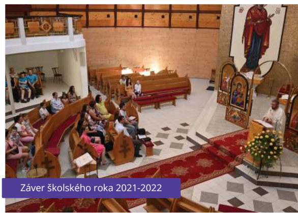
Záver školského roka 2021-2022