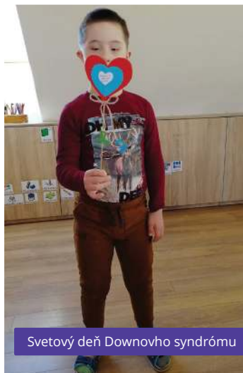
Svetový deň Downovho syndrómu