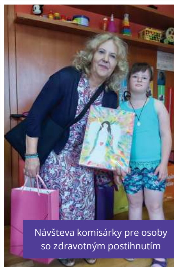
Návšteva komisárky pre osoby so zdravotným postihnutím