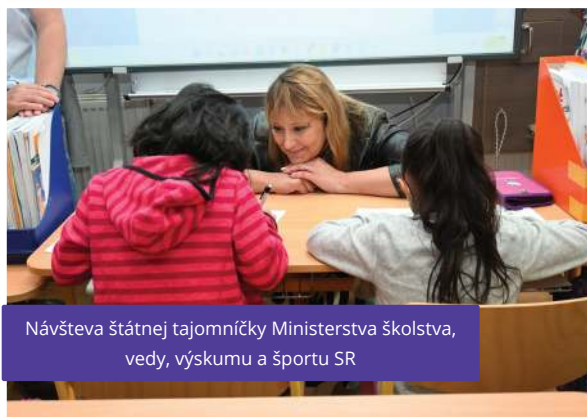
Návšteva štátnej tajomníčky Ministerstva školstva, vedy, výskumu a športu SR