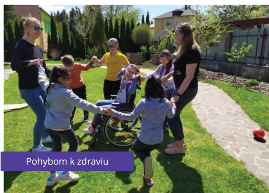
Pohybom k zdraviu