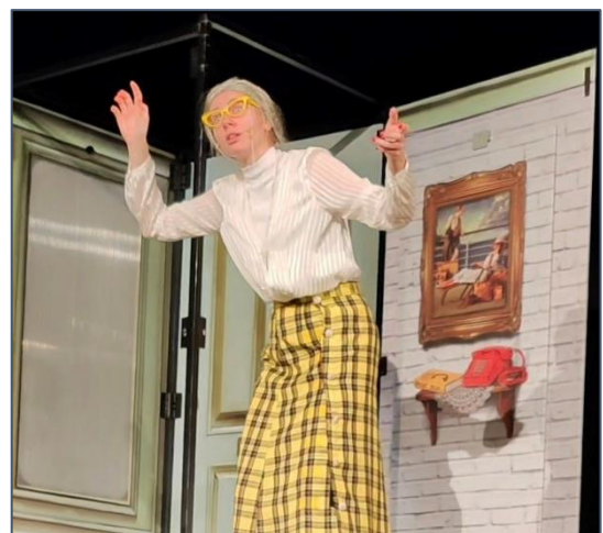
PK cudzích jazykov