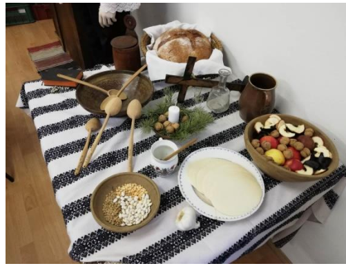
Ako vyzeral štedrovečerný stôl kedysi