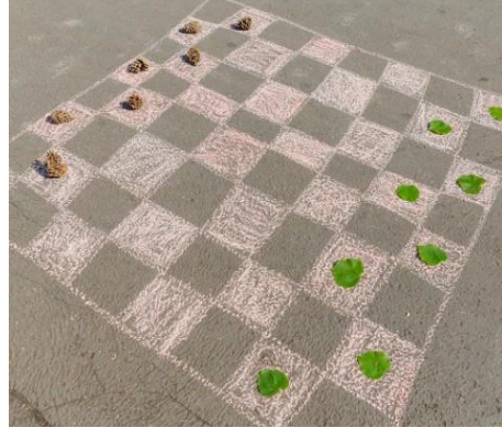
šach - dáma