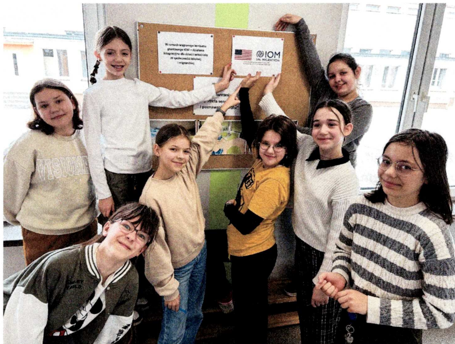
Zdjęcia (wystaczy jedno)