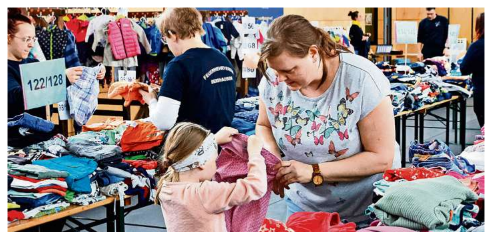
Viele Mütter hatten ihre Kinder zum Anprobieren mit gebracht.

und Spielsachen zum Verkauf eingeliefert. Vieles fand dankbare Abnehmer. Rudolph geht von etwa 2500 verkauften Sachen aus. Zehn Prozent des Erlöses gehen wieder an die Kinder- und Jugendfeuerwehr. „Wir sind sehr dankbar für die erfahrene finanzielle und materielle Unterstützung der Stadt und