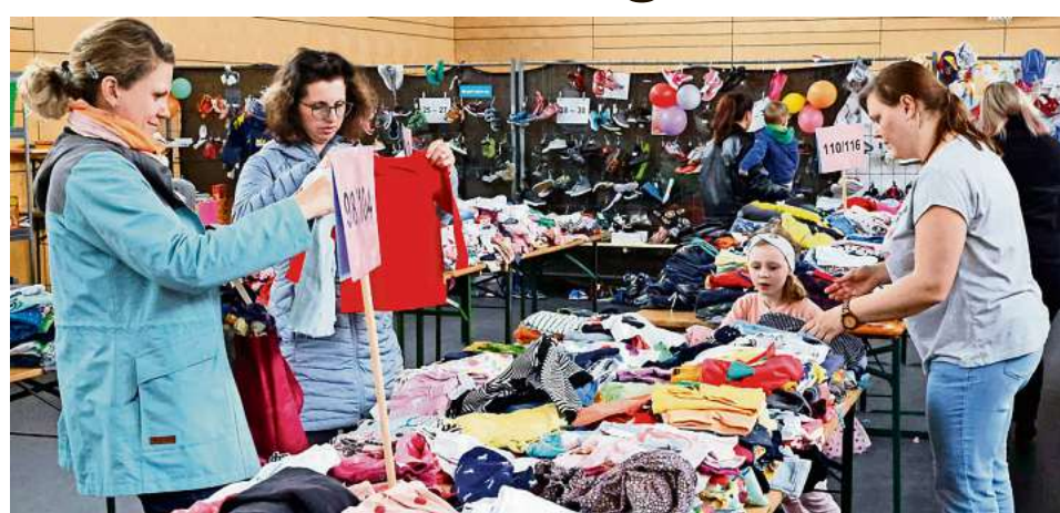
Die Auswahl an gut erhaltenen Kindersachen war riesig.