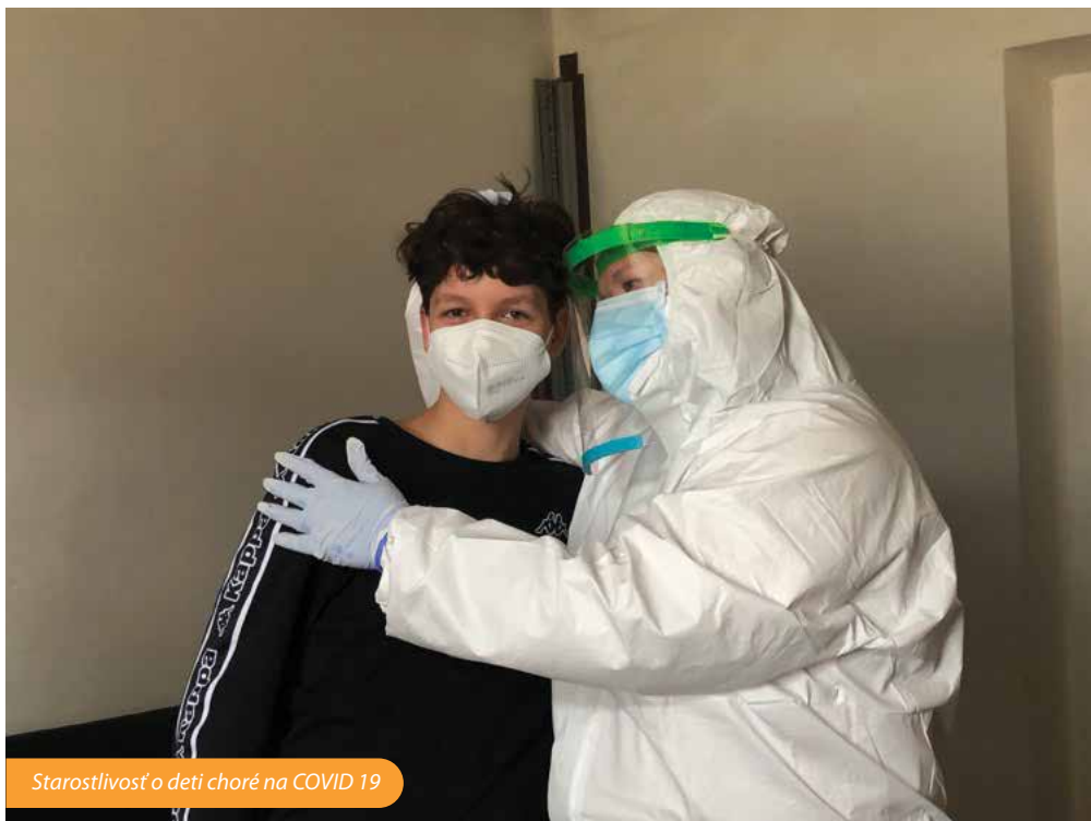
Starostlivosť o deti choré na COVID 19