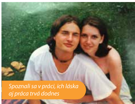
Spoznali sa v práci, ich láska aj práca trvá dodnes

Tatrabanka IBAN SK12 1100 0000 0026 2370 6922