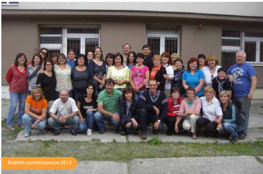
Kolektív zamestnancov 2013