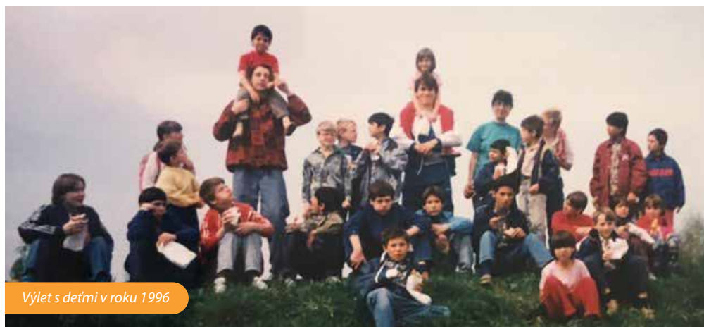
Výlet s deťmi v roku 1996