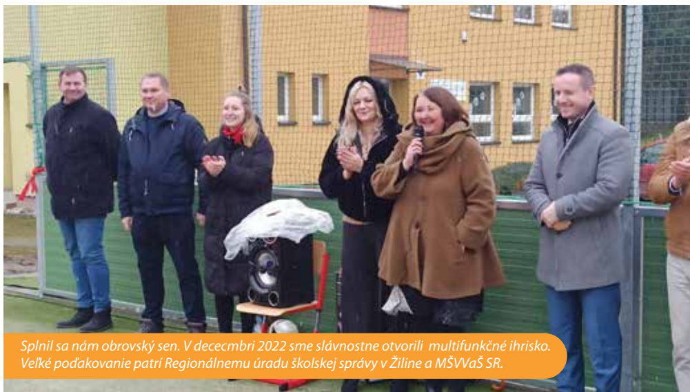
Splnil sa nám obrovský sen. V decembri 2022 sme slávnostne otvorili multifunkčné ihrisko. Veľké podakovanie patrí Regionálnemu úradu školskej správy v Žiline a MŠVVaŠ SR.