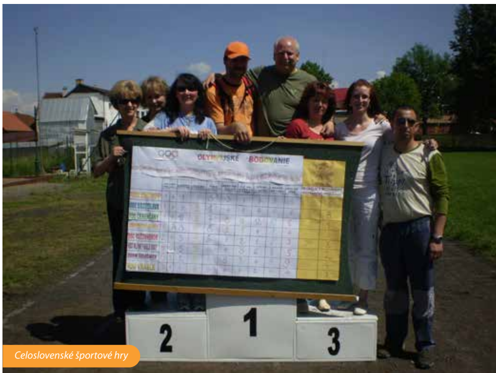
Celoslovenské športové hry