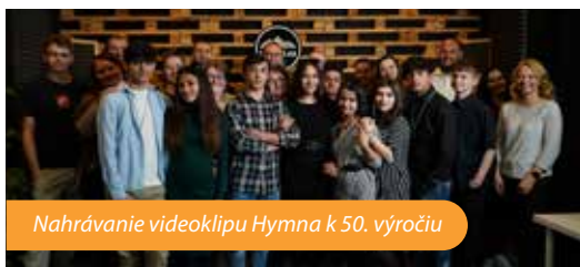
Nahrávanie videoklipu Hymna k 50. výročiu