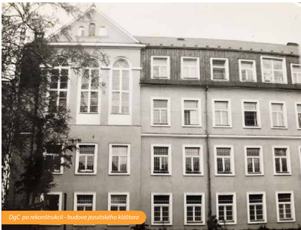
DgC po rekonštrukcii - budova jezuitského kláštora