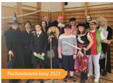
Pochovávanie basy 2023