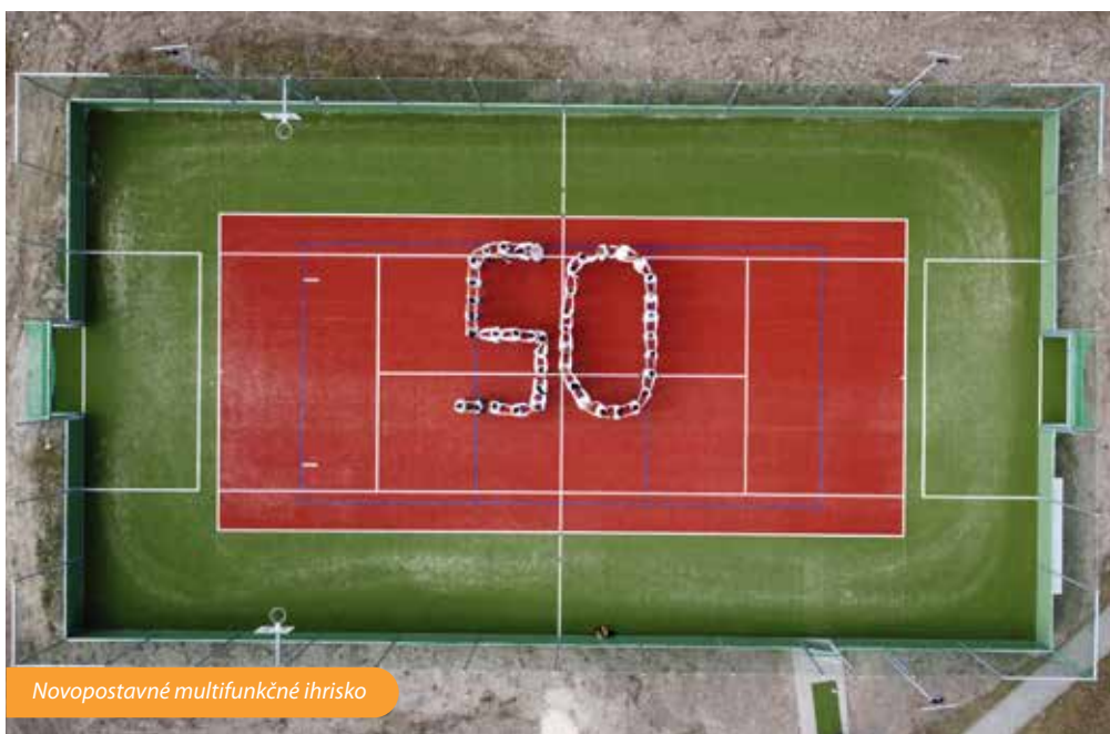
Novopostavné multifunkčné ihrisko