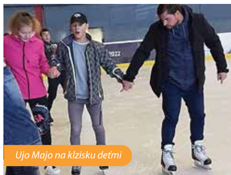
Ujo Majo na klzisku deťmi