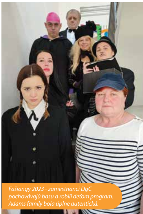
Fašiangy 2023 - zamestnanci DgC pochovávajú basu a robili deťom program. Adams family bola úplne autentická.

Keďže deti našich zamestnancov volajú teta a ujo, aj popisy fotiek uvádzame týmto spôsobom. Pre deti je pomenovanie teta/ujo familiárnejšie a vytvára sa tak dôvernejšia atmosféra vo vzťahu dieťa-dospelý.