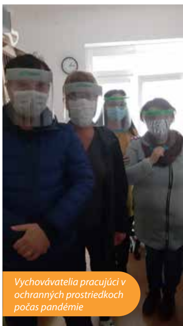
Vychovávateľa pracujúci v ochranných prostriedkoch počas pandémie