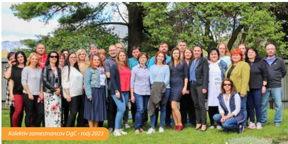
Kolektív zamestnancov DgC - máj 2023