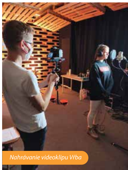
Nahrávanie videoklipu Vŕba