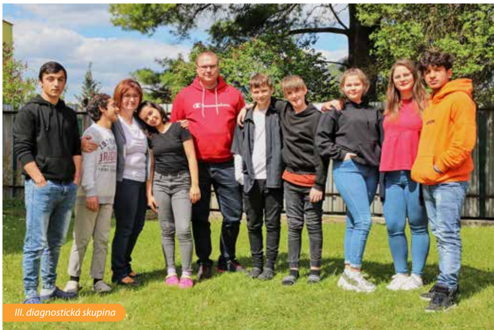
III. diagnostická skupina