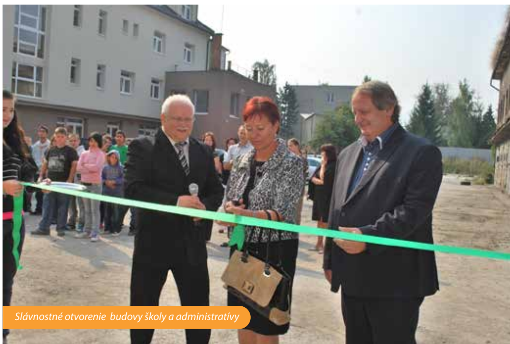
Slávnostné otvorenie budovy školy a administratívy