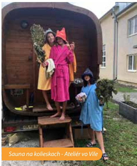
Sauna na kolieskach - Ateliér vo Vile