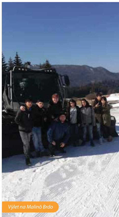
Výlet na Malinô Brdo