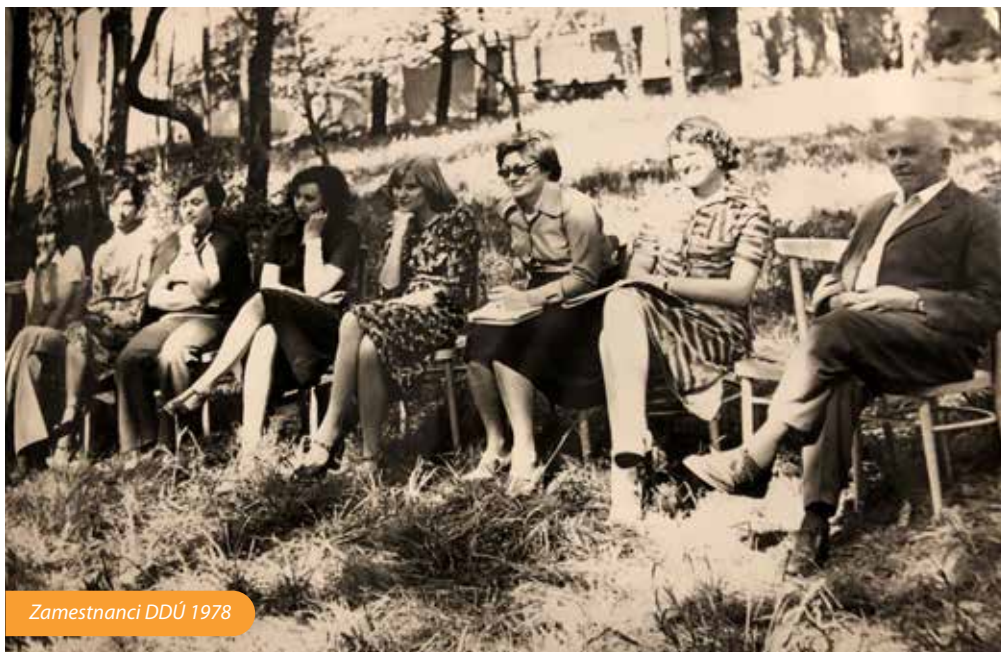
Zamestnanci DDÚ 1978