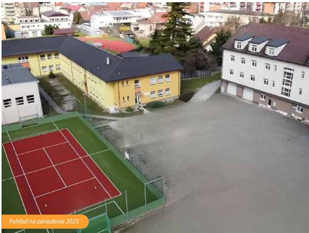
Pohľad na zariadenie 2023