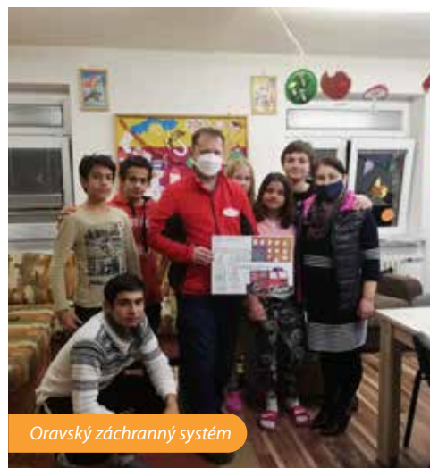
Oravský záchranný systém