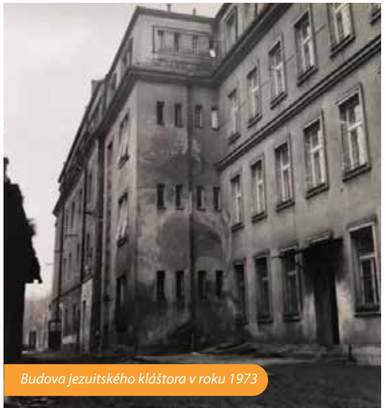
Budova jezuitskeho kláštora v roku 1973