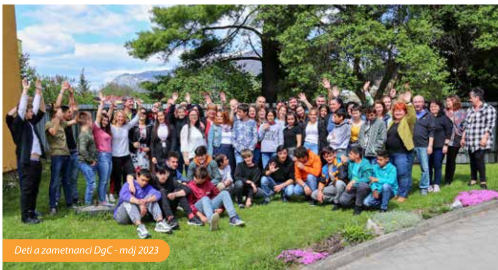
Deti a zamestnanci DgC - máj 2023