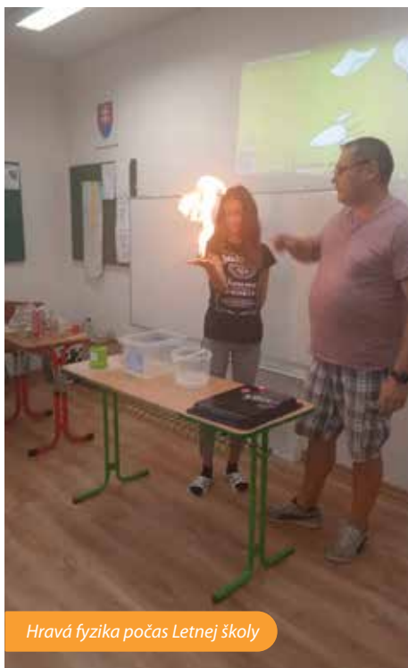
Hravá fyzika počas Letnej školy