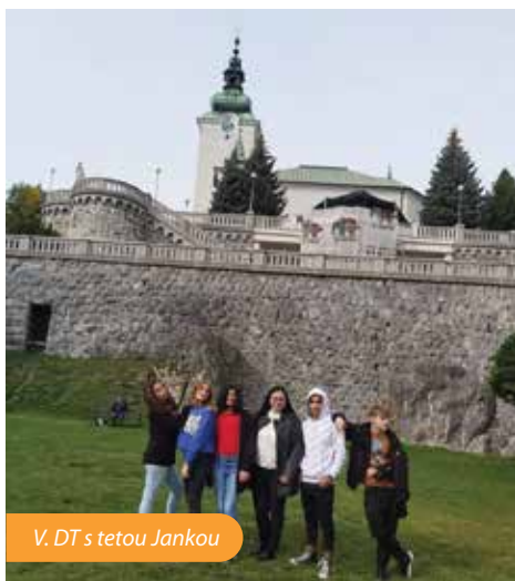
V. DT s tetou Jankou