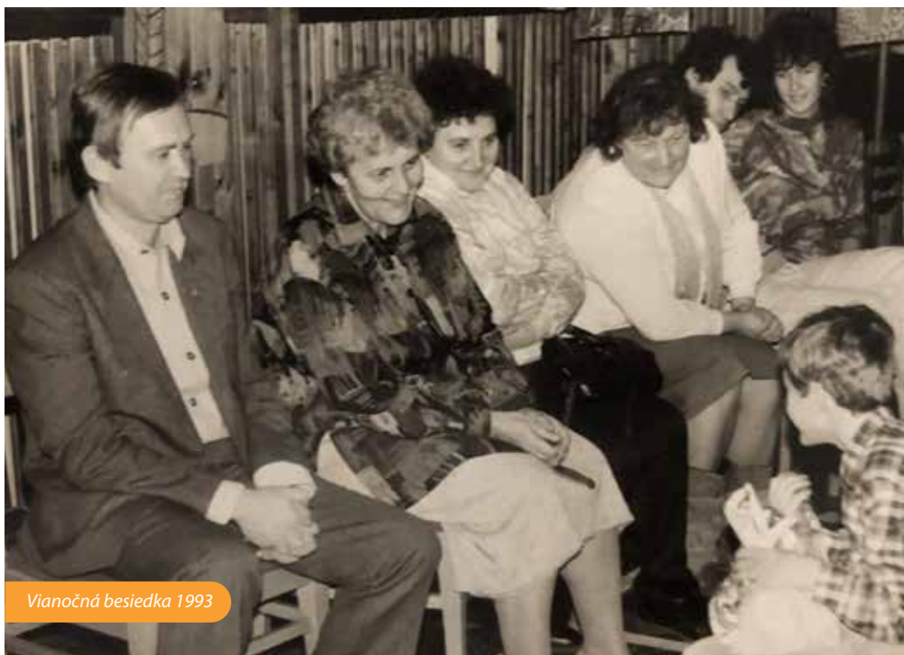
Vianočná besiedka 1993