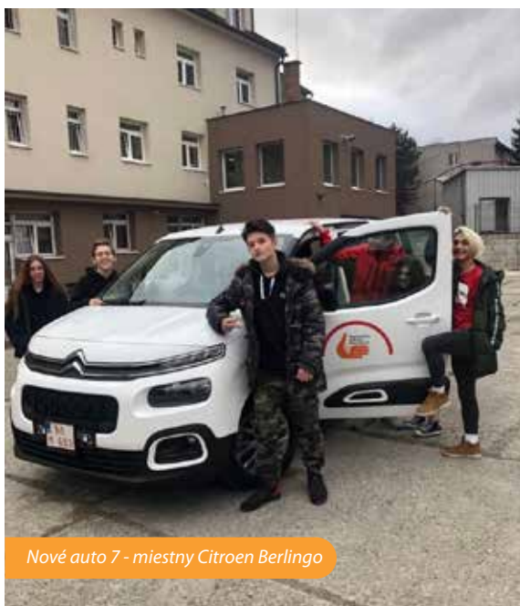
Nové auto 7 - miestny Citroen Berlingo