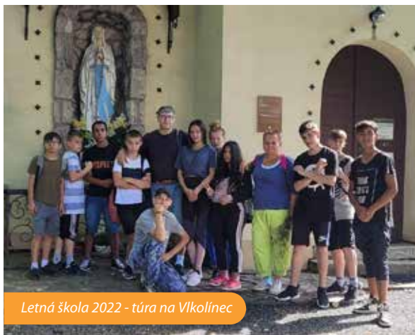
Letná škola 2022 - túra na Vlkolínec