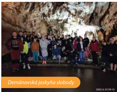
Demänovská jaskyňa slobody