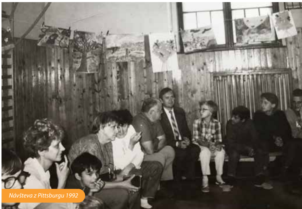
Návšteva z Pittsburgu 1992