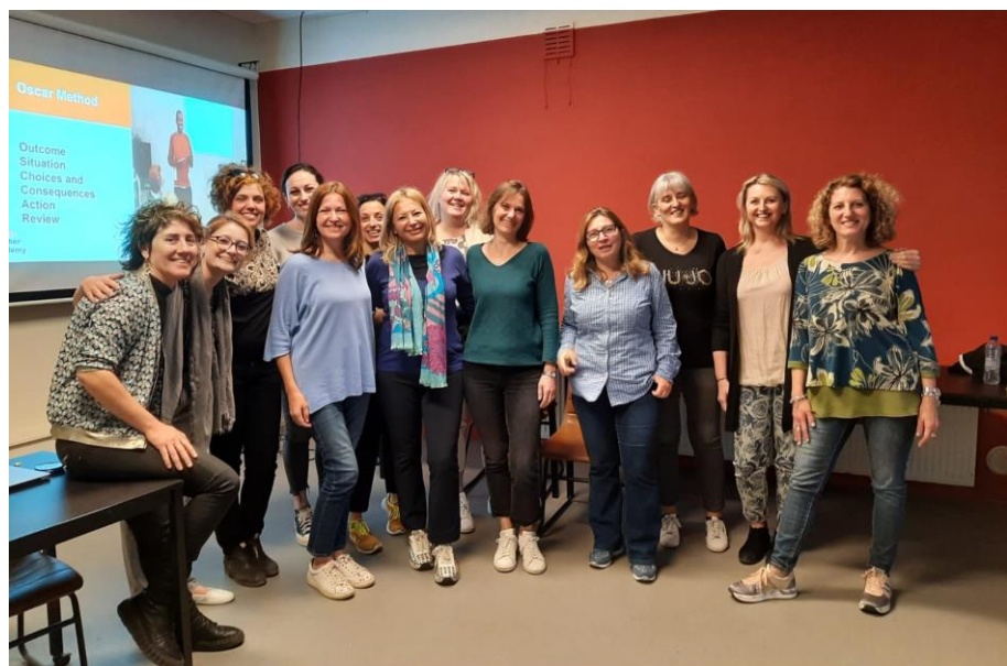
Vypracovala: Miriam Klimová