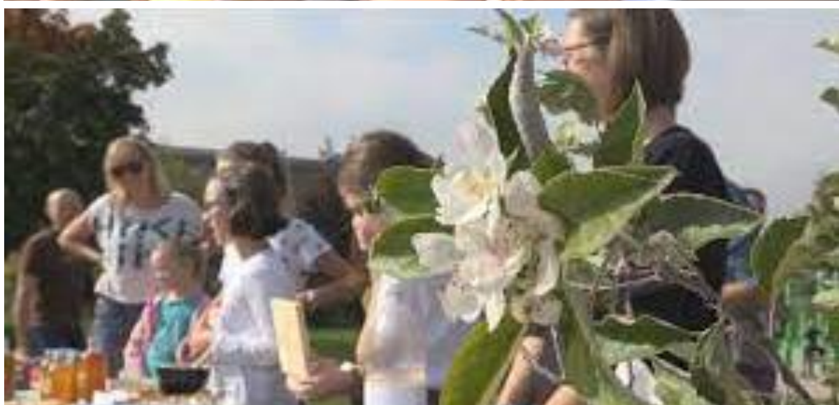
Autorky: Soňa Procházková, Dorotka Vodislavská