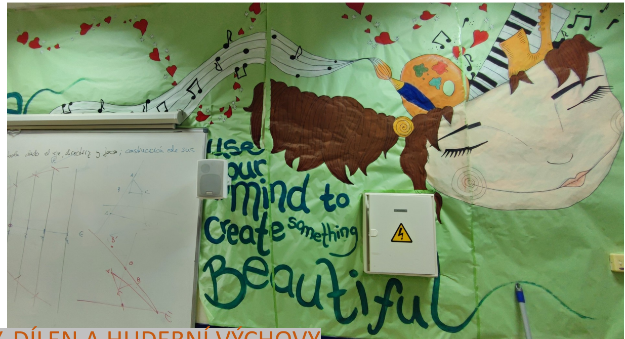
UČEBNA VÝTVARNÉ VÝCHOVY, DÍLEN A HUDEBNÍ VÝCHOVY