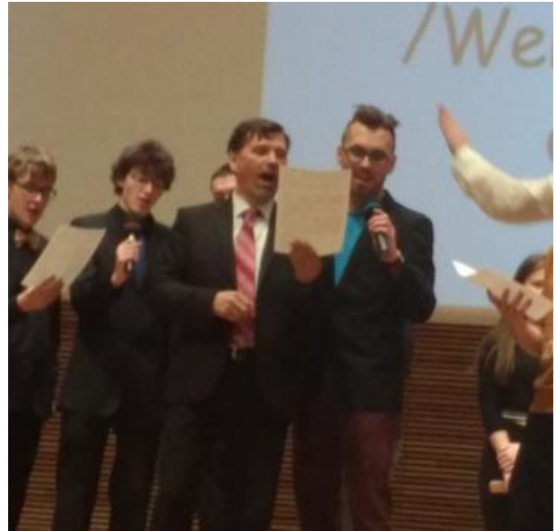
Byliśmy dumni z naszego dyrygenta, który świetnie zaprezentował się w roli „tenora”.